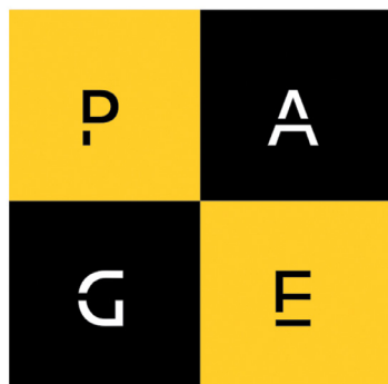
PROGRAMME D'AMÉLIORATION DE LA GESTION DE VOS ÉQUIPES

PROGRAMME DE COMPÉTENCES AVANCÉES EN GESTION PERMETTANT LE DÉPLOIEMENT DU LEADERSHIP PAR LA CONCRÉTISATION DES APPRENTISSAGES ET L'ACTIVATION DES COMPÉTENCES